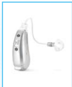
耳掛耳內接受器型